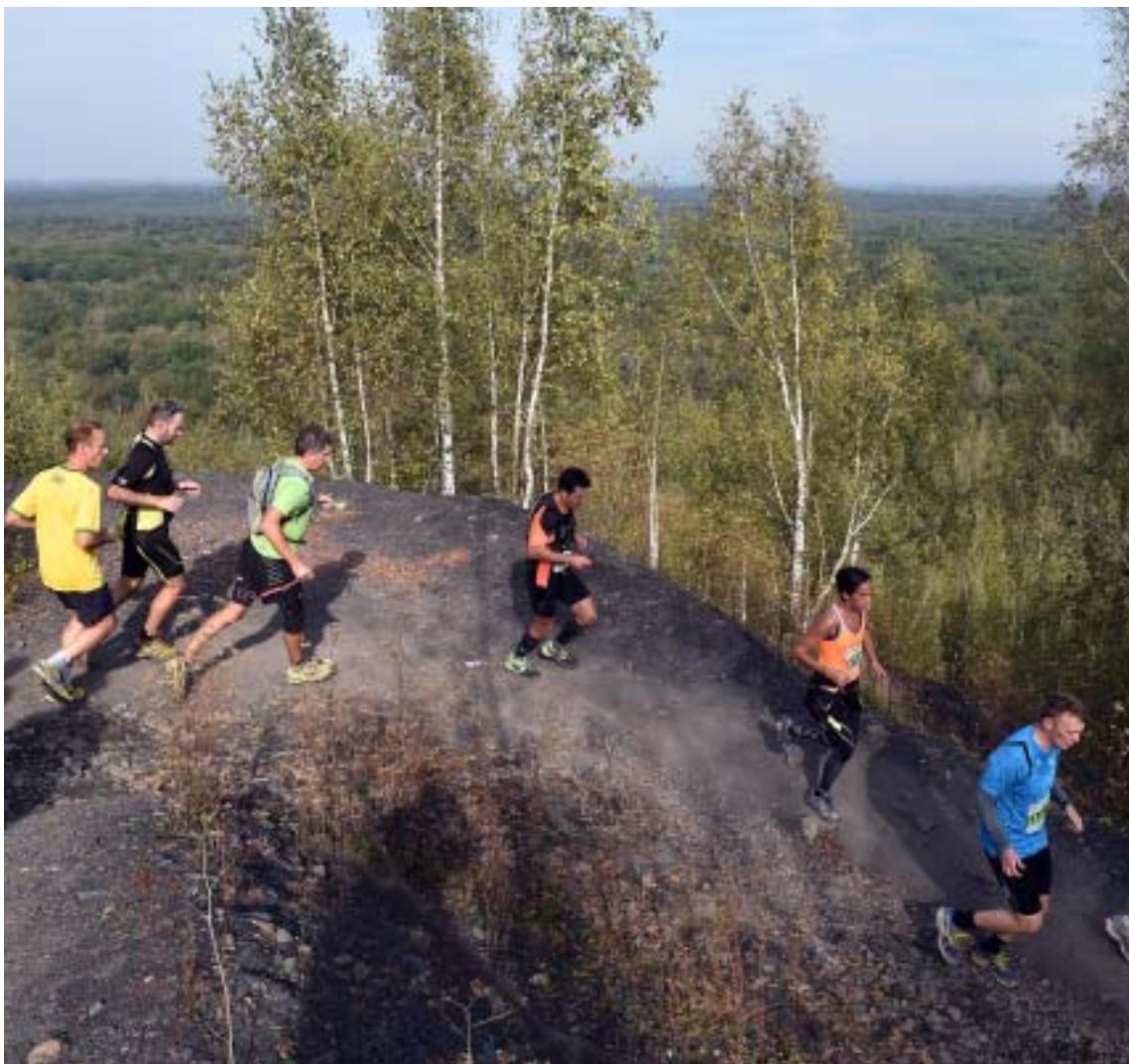
Du haut du deuxième terril de Sabatier, vue imprenable sur le massif forestier. Après la souffrance de la montée, la récompense.