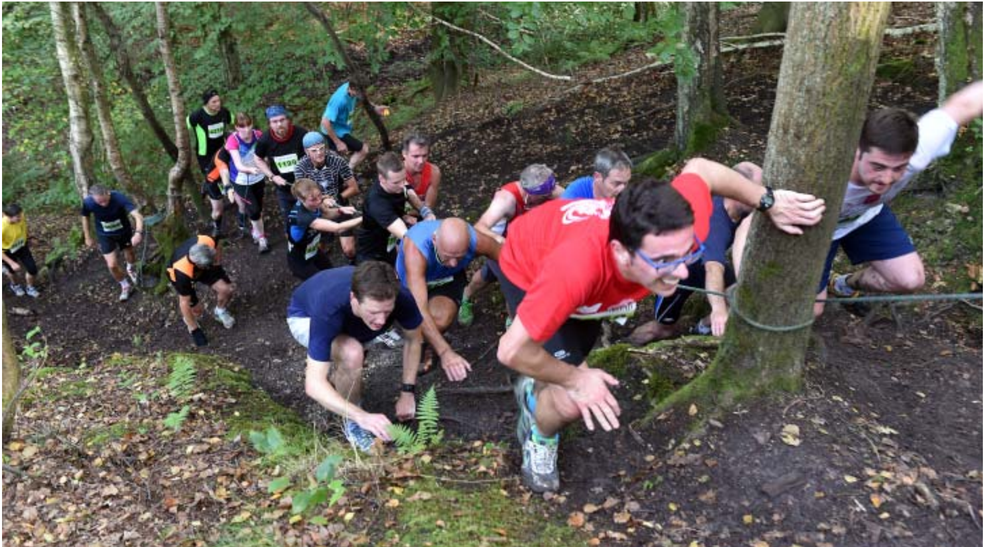
Niché au cœur de la forêt, le terril du Mont des Ermites n'est peut-être pas le plus spectaculaire mais après 22 km de course, il fait mal aux pattes. Demandez un peu aux concurrents de la Sauvage...