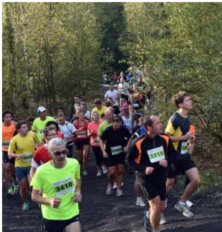
La course n'en est pas à son deuxième kilomètre que déjà se dresse la première difficulté, le terril de Sabatier 1, vers lequel les regards se tournent.

La Cafougnette ▶ 1. Rémi Leurs (Bondues), les 57 km en 4 h 47'28" ; 2. Levaux (Team Raidlight), 5 h 08'36" ; 3. Mordelet (Quechua), 5 h 11'14" ; 4. Moisson (Boulogne-sur-Helpe), 5 h 14'10" ; 5. Berthel (Mauchamps), 5 h 15'33"... 23. Patoux (Wambaix, 1 re femme), 6 h 24'15"... La Sauvage ▶ 1. Thierry Breuil, les 25 km 1 h 34'13" ; 2. Potteau (Valenciennes), 1 h 38'38" ; 3. Xhaufclair (Villeneuve-d'Ascq - Fretin), 1 h 39'47"... L'Authentique ▶ 1. Cyril Caré (USVA), les 16 km en 1 h 0'46" ; 2. Ponchaut (Anzin), 1 h 01'29" ; 3. Balavoine (Jaux), 1 h 02'30"... La Furtive ▶ 1. Raphaël Demarcq (AS Raismes), les 9 km en 33'15" ; 2. Dufief (AS Raismes), 33'36" ; 3. Semail (Anzin), 34'46"... Les Allumés ▶ 1. Pierrick Bernard, les 9 km en 32'32" ; 2. Potteau, 32'33" ; 3. Breuil, 32'34"... 12. Jamsin (1 re femme), 37'... ■