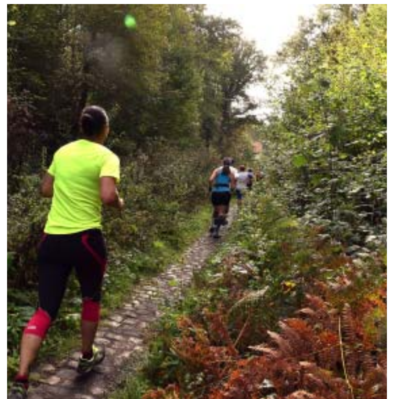
Aux grandes longueurs de drèves, les passages en sous-bois et les petits sentiers ont été privilégiés par les organisateurs sur le tracé.